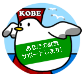
ハローワーク神戸マスコットキャラクター ハロかもめ