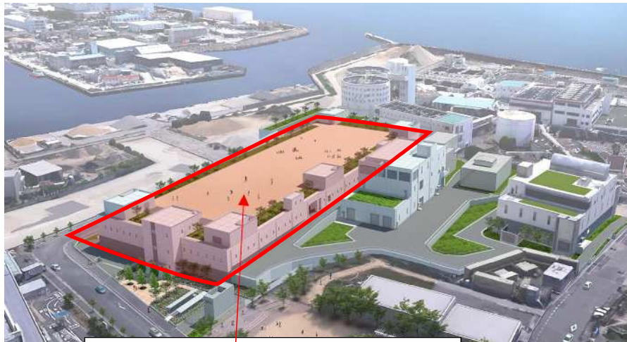
完成予想図 工事箇所(この建屋の地下部分)