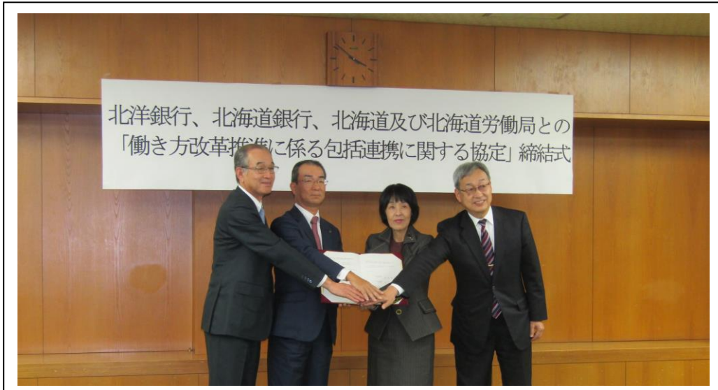
（左から、北洋銀行石井頭取、北海道銀行笹原頭取、北海道高橋知事、北海道労働局引地局長）