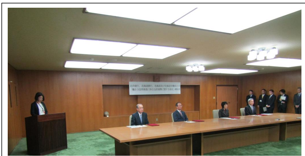
（協定式が行われた北海道知事会議室の全景）