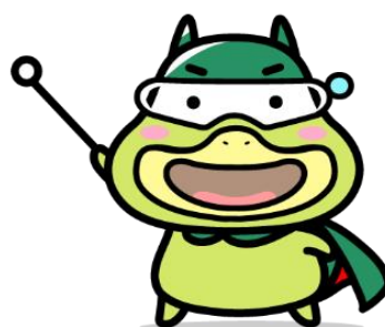
労働基準局広報キャラクター 「たしかめたん」