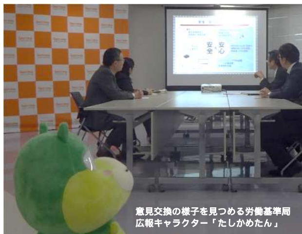
意見交換の様子を見つめる労働基準局 広報キャラクター「たしかめたん」