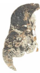
じん肺に罹患した肺

主に小さな土ぼこりや金属の粒などの粉じんを長年吸い込むことで、肺の組織が線維化し、硬くなってしまふ病気で、根本的な治療がありません。