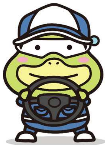
労働基準局広報キャラクター たしかめたん