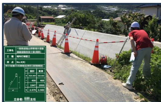
←「電子小黒板ソフト」使用状況 (作業員が現場で実際に黒板を持つことなく、同様の撮影ができる)

上記取組のほか、現場業務従事者について、工事終了後に一定のまとまった年次有給休暇の取得(リフレッシュ目的での休暇取得)など社内で促進。それらの結果、労働者の ◆時間外労働時間数は、令和2年度20.49時間/月 → 令和4年度13.1時間/月 ◆年次有給休暇取得率は、令和2年度53.1% → 令和4年度57.6% へと向上!