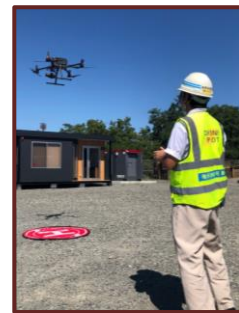
↑ドローン測量の様子