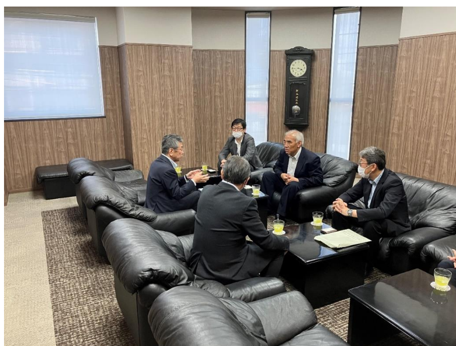
友藤局長(右から2人目)、新谷社長(左)

当署では、管内の企業が「働き方改革」を積極的に進めるため、今後とも、必要な情報提供や訪問支援等を行っていきます。