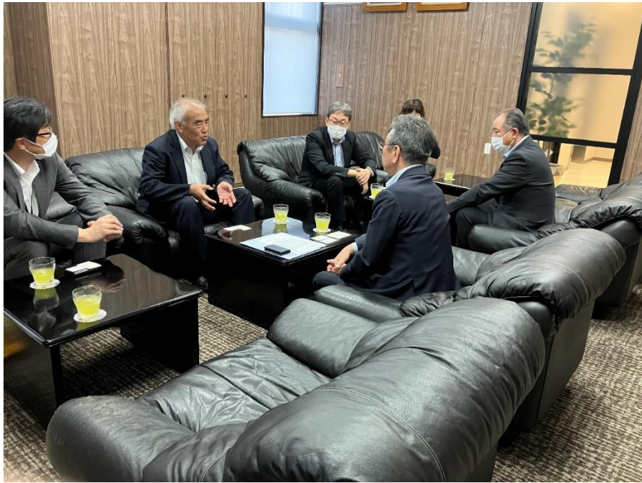
友藤局長(左から2人目)