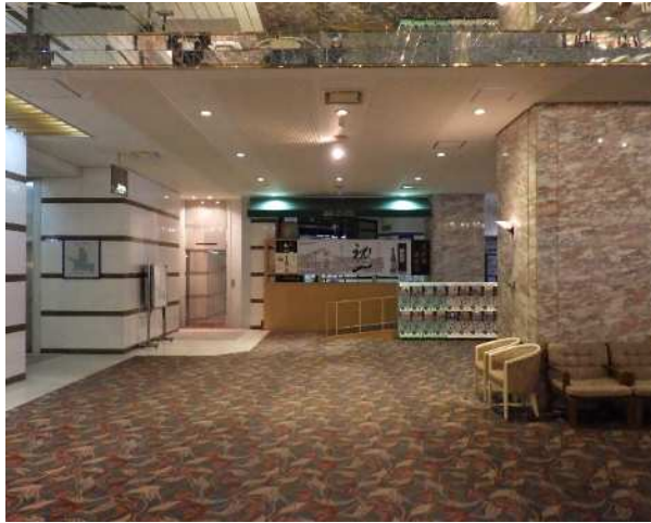
<工事前 E L V 廻り>