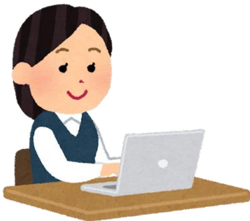
マザーズハローワーク札幌

ハローワークのスタッフ による1対1のリアルタイム 相談のため、迅速かつ的 確なアドバイス！