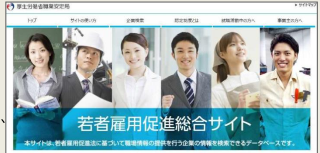
「若者雇用促進総合サイト」

個別企業ごとに企業概要、雇用管理の状況、求職者に向けたメッセージなどを掲載することで、積極的な企業情報の発信と若者とのマッチングを促進していきます。