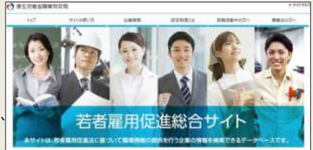
「若者雇用促進総合サイト」

個別企業ごとに企業概要、雇用管理の状況、求職者に向けたメッセージなどを掲載することで、積極的な企業情報の発信と若者とのマッチングを促進していきます。