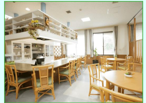
社会福祉法人小樽育成院 H.P より