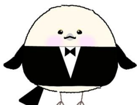
ハローワークプラザ札幌公式キャラクター プラえなが