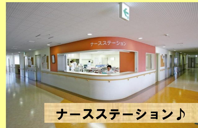
ナースステーション♪