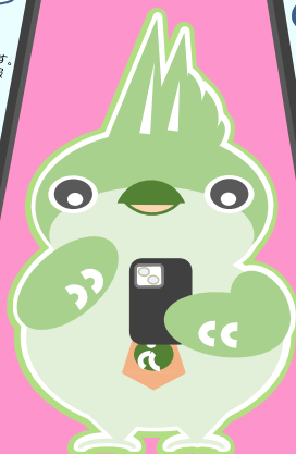
ハローワーク千歳 公式キャラクター やまっち

■ 求人 ■ 職業訓練 ■ お仕事探し などお仕事に関する言葉を話しかけてください！ やまっちがお役立ち情報をお伝えします♪