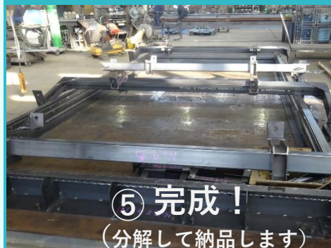
⑤完成！ (分解して納品します)