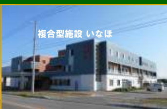
複合型施設 いなほ