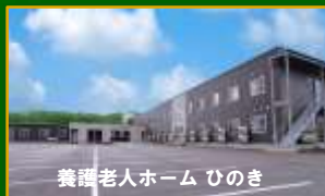
養護老人ホーム ひのき