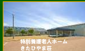
特別養護老人ホーム きたひやま荘