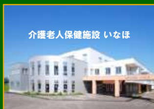
介護老人保健施設 いなほ