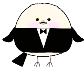
ハローワークプラザ札幌公式キャラクター ブラえなが