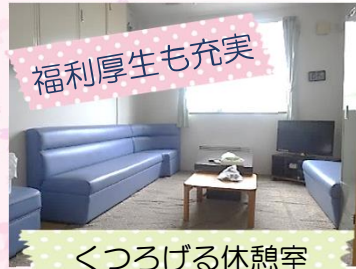
くつろげる休憩室