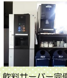
飲料サーバー完備