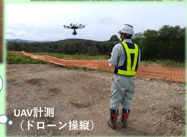
UAV計測 (ドローン操縦)