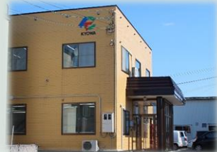
事業室 (営業、総務部)

所在地 : 北海道旭川市神楽6条1丁目4番12号 事業内容 : 742 土木建築サービス業 : 路線測量、用地測量、調査設計、補償コンサル 事業所番号 : 0103-011223-1