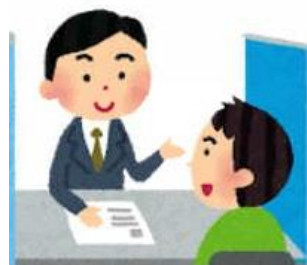
職業相談窓口 (説明会参加の推奨)

参加者からの声では、 ・所内掲示板で知った ・H.Pを見て参加した ・窓口で勧められた 以上の3つが多いです