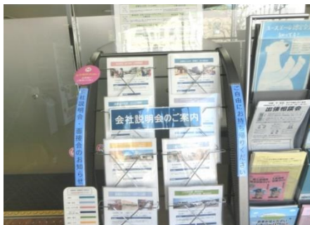
正面玄関内 (ラックにリーフレット・会社資料 等)