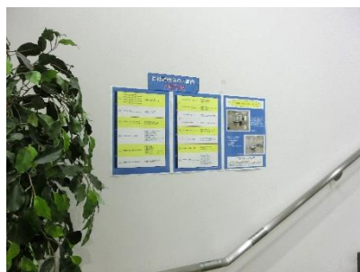
階段踊り場 (北側階段)