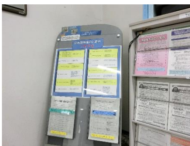
給付窓口横 (雇用保険課)