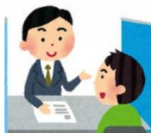
職業相談窓口 (説明会参加の推奨)

参加者からの声では、 ・H.Pを見て参加した ・週刊ワーク情報で知った ・窓口で勧められた 以上の3つが多いです