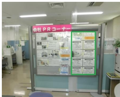
会社PRコーナー (正面玄関入って直ぐの掲示板)

会社リーフレットには、画像、募集中の求人内容（業種・雇用形態など）、会社概要、会社PRを載せています