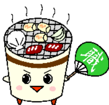
（公式キャラクター：マッチ）