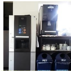
飲料サーバー完備