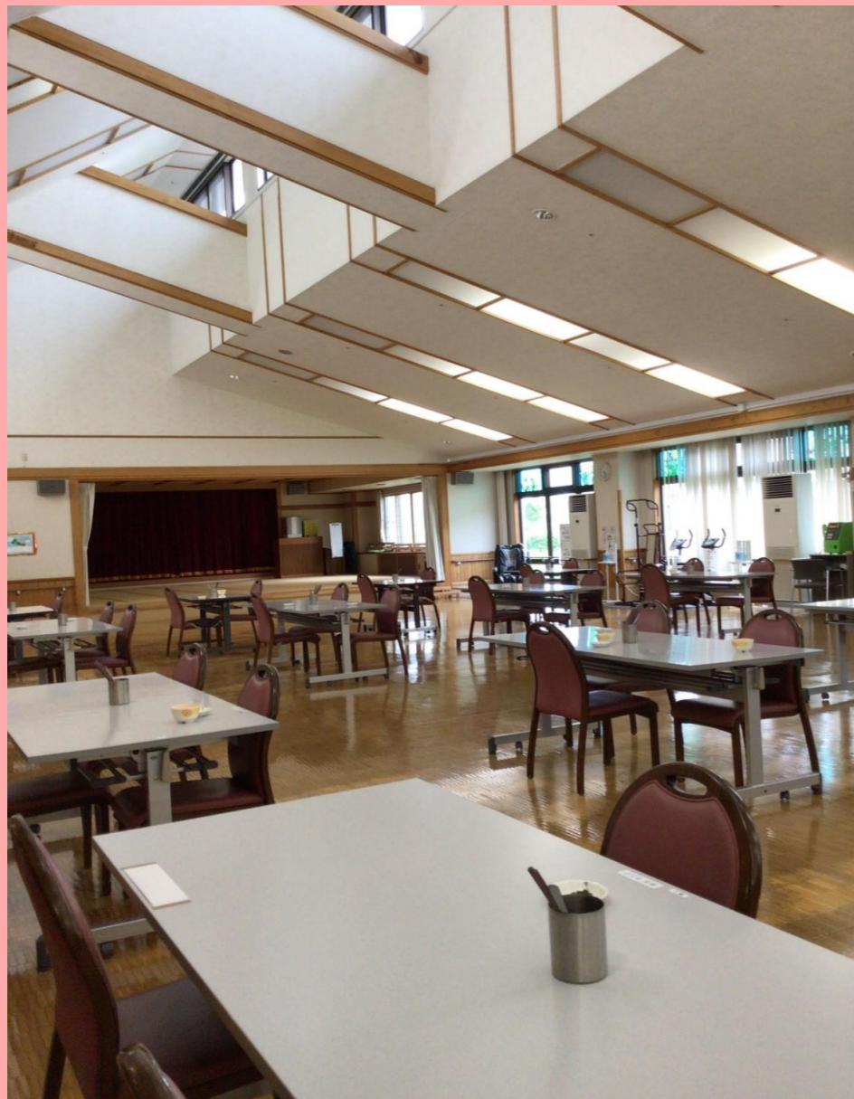
ホール・食堂の様子（左の写真）

食が進む明るく快適な空間。開放感溢れる吹き抜けの天井に天窗を配置し、暖かな日差しをいっぱいに取り入れたホール内は、多目的ホールや食堂、和洋室、舞台、そして浴室やトイレなどが利用しやすく配置された大空間となっています。