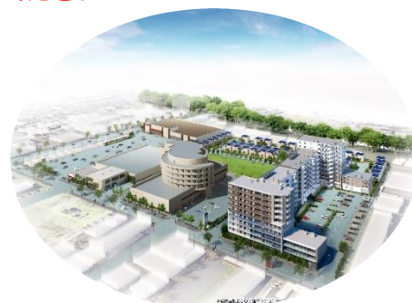
※12月移転先イメージ