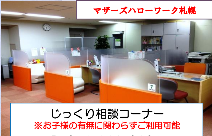
マザーズハローワーク札幌