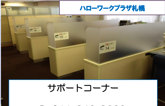
ハローワークプラザ札幌