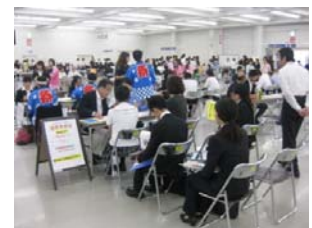
福祉の就職総合フェアの様子