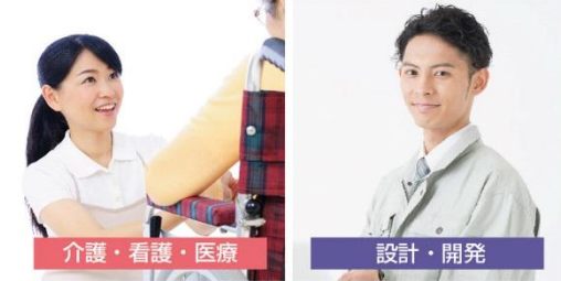
介護・看護・医療