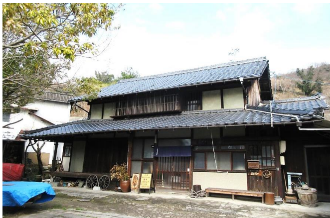
【 レストラン外観 】