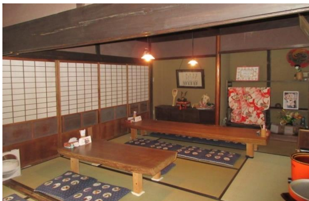
【 客席 】