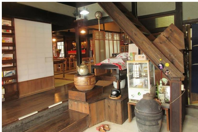
【 玄関を入ったところ 】