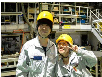
<20代・30代の先輩も多数活躍中>