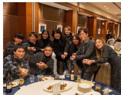
<社員の仲も良く働きやすい職場環境>