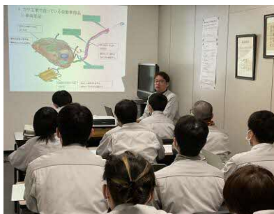
<研修・教育制度も充実>