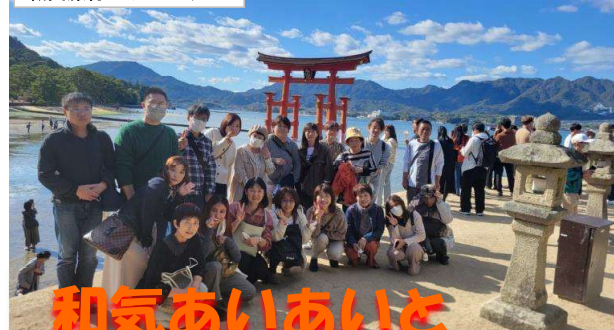
職員旅行でリフレッ