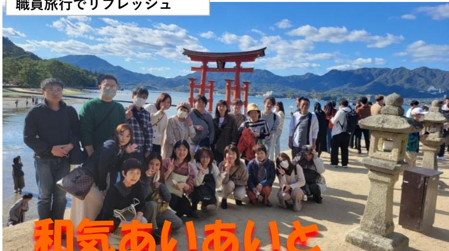
職員旅行でリフレッシュ