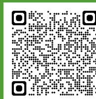
オンラインセミナー利用規約はこちら※2