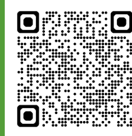
ハローワークインターネットサービス※1

右の二次元コード、「ハローワークインターネットサービス ※1」にアクセス、「マイページを開設して求職申込み」ボタンをクリックし、登録をお願いします。