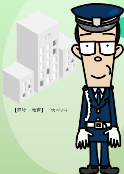
【建物・教育】大学2白