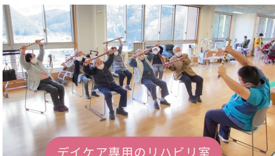
デイケア専用のリハビリ室

1日の利用者は50～60名。 日によって利用者が変わるため、顔を覚えるまでは大変かもしれませんが、入社後3ヶ月間はマンツーマンで指導してもらえます。