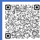
オンラインセミナー 利用規約※ 2