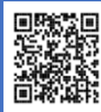
ハローワークインターネット サービス※ 1

右の二次元コード、「ハローワークインターネット サービス ※ 1」にアクセス、「マイページを開設 して求職申込み」ボタンをクリックし、登録をお願い します。