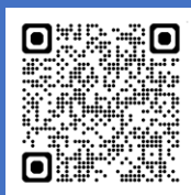
参加申込フォーム※ 3

（入力いただいたメールアドレスに招待メールを 送信しますので、間違えないようお願いします。）