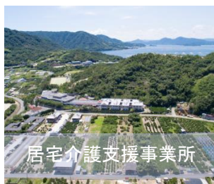
居宅介護支援事業所

江田島市の豊かな自然の中、広い敷地には介護度の段階に応じたさまざまな施設があります。