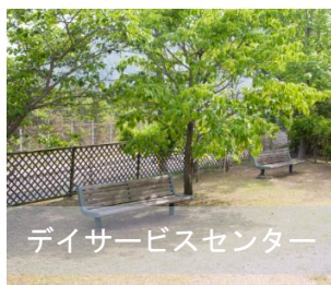
デイサービスセンター