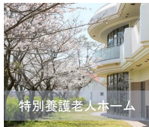
特別養護老人ホーム