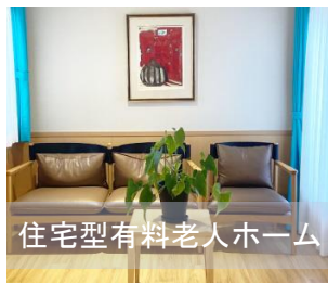
住宅型有料老人ホーム