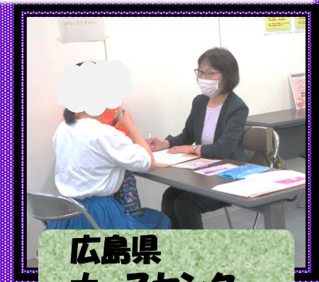
広島県 ナースセンター