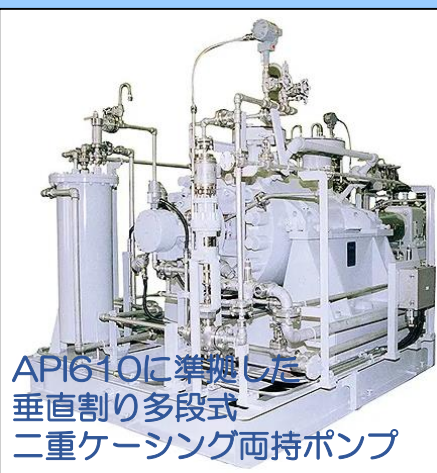
API610に準拠した 垂直割り多段式 二重ケーシング両持ポンプ