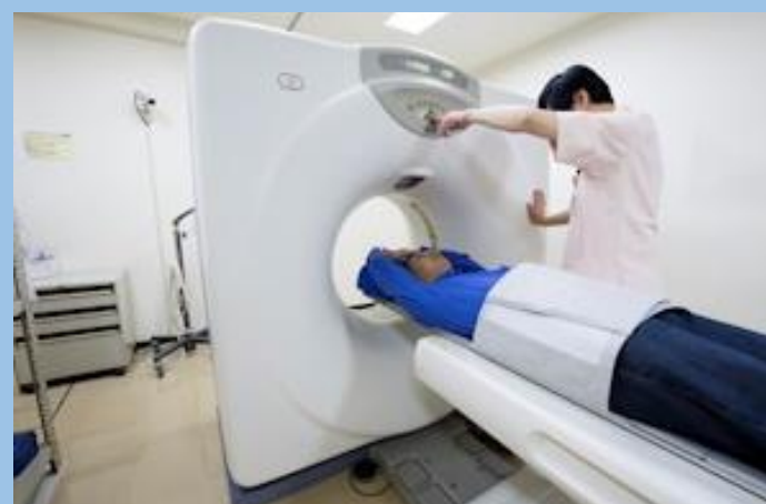
MRI・CTなど最新鋭の設備

横山病院は、地域の皆様の健康のために専門的な医師（脳神経外科・脳神経内科・循環器内科・内科・リハビリテーション科）やスタッフによる、脳ドックや生活習慣病の治療などの脳神経の病気の予防、MRIやCTなどの機器を使用した検査、脳卒中（脳梗塞・脳出血）や慢性硬膜下血腫の手術などの治療、リハビリテーションに取り組んでおります。