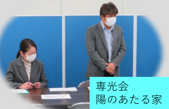
専光会 陽のあたる家