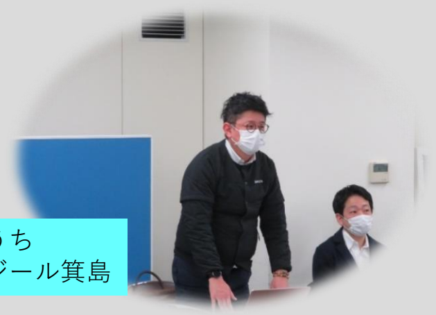
せとうち プレジール箕島