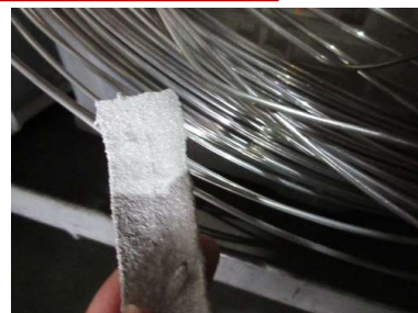
※写真はアルミニウム