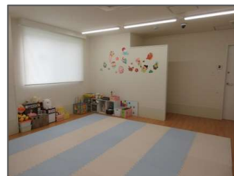
病児・病後児保育室