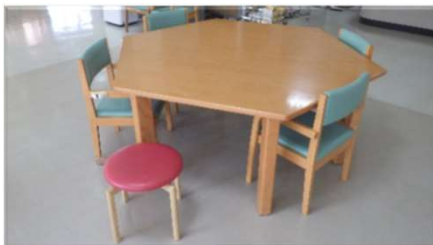
【デイ】個人に併せた椅子と机