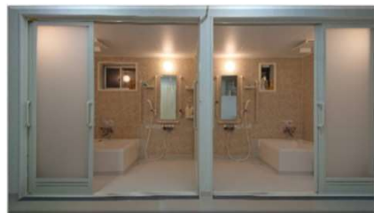
【特養】プライバシーに配慮しゆっくり浸かれる