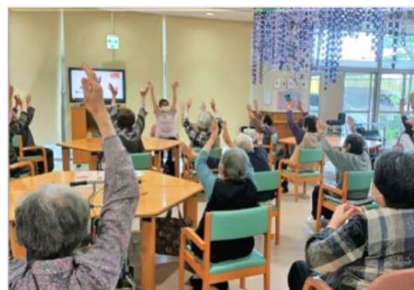
【デイ】日々のレクリエーションの様子