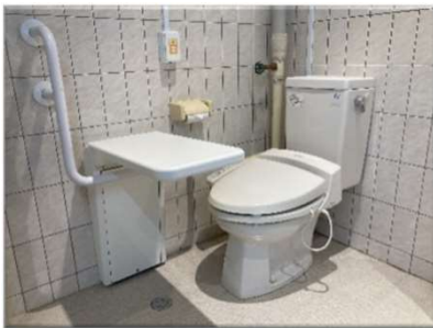
【特養】座ることが出来ればトイレに行ける