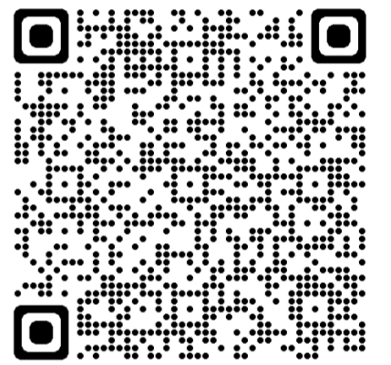
オンラインセミナー 利用規約 ※1

(1)右横の二次元コードもしくは、広島新卒応援ハローワークホームページから、「オンラインセミナー利用規約 ※1」を確認してください。 (申し込みをいただいた時点で、本利用規約に同意されたものとみなします。)