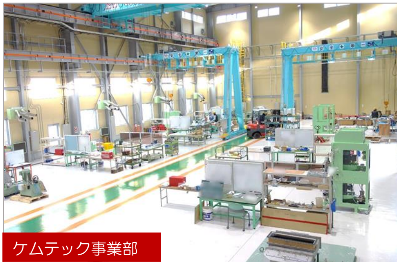
ケムテック事業部

人を中心に据えて考え、行動する企業体であろう。「人を中心に据えて」福利厚生棟を新築。シャワールーム・女子休憩室・筋トレルーム完備。無人の売店も設置しました。「職場の安全、みんなの健康を第一とし、人が育つ会社造りを目指します。」