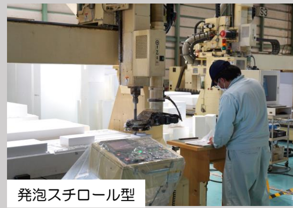
発泡スチロール型