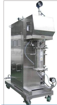
ウルトラアベックスミル